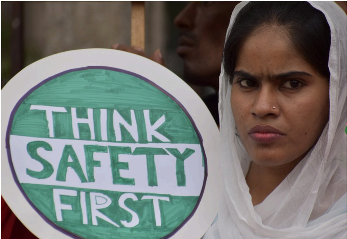
Clean Clothes Campaign, pas de date

L'importance de l'Accord est reconnue par les 200 marques ayant signé les différentes moutures qui ont suivi depuis 2013, comme H&M, Uniqlo, Inditex (Zara) ou encore PVH (Calvin Klein). Pourtant, d'autres grandes marques manquent à l'appel en se cachant derrière des auto-contrôles, des audits et des initiatives dirigées par l'industrie sans contribution syndicale. C'est le cas de Levi's, IKEA, Decathlon, Auchan, ou encore Kiabi.