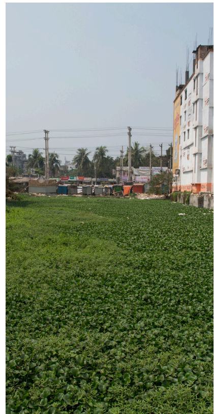
Clean Clothes Campaign, pas de date