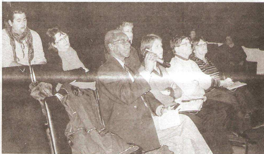
Les auditeurs ont pu échanger avec Dakar via le net pendant les débats du Forum social mondial.