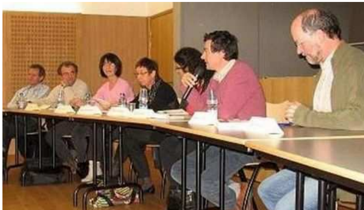
La table officielle avec les intervenants.